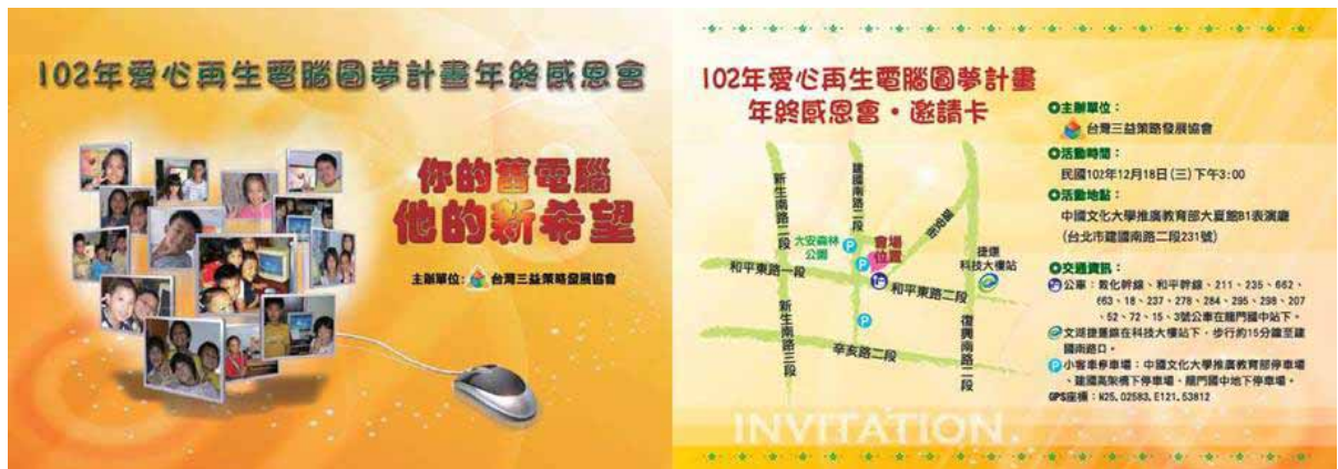
年終感恩會邀請卡