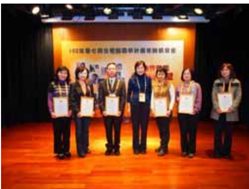
頒發感謝狀予今年捐贈廢電腦單位