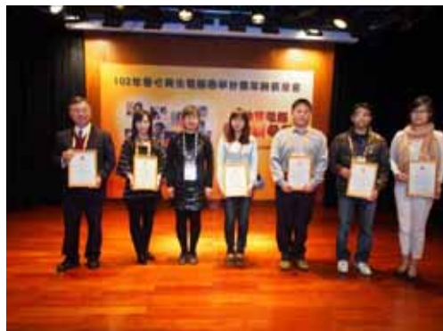
頒發感謝狀予今年捐贈廢電腦單位