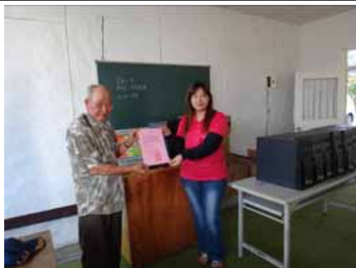
花蓮縣玉里鎮原住民終身學習協會