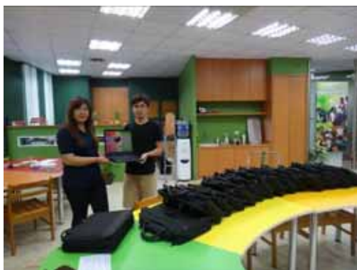
元智大學課外組國際志工團