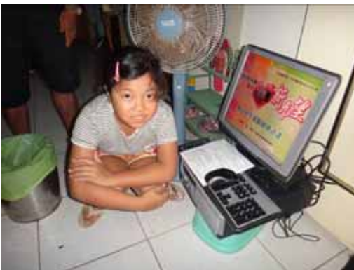
張 OO-屏東縣恆春鎮德