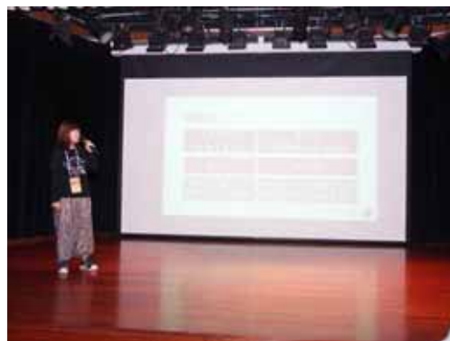
受贈單位心情分享