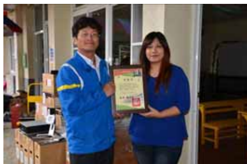
嘉義縣阿里山鄉香林國小