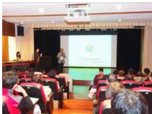
本會理事長分享今年成果