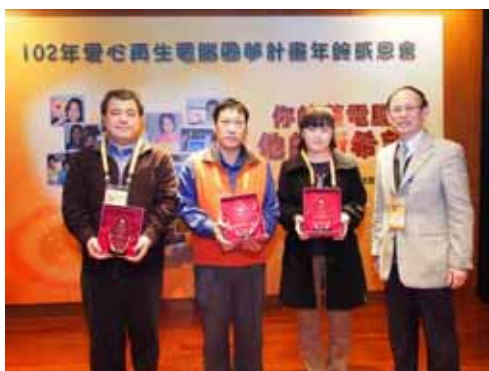
頒發感謝獎牌予今年捐贈廢電腦單位