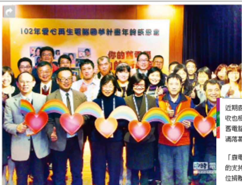
「你的舊電腦，他的新希望·愛心再生電腦圓夢」勸募活動合影。

近期廢水處理議題掀起企業界對環保的重視，其實舊電腦回收也相當重要。台灣三益策略發展協會主辦的102年「你的舊電腦，他的新希望」愛心再生電腦圓夢勸募活動計畫圓滿落幕，總計有442個家庭、8個國內社團團體受惠。