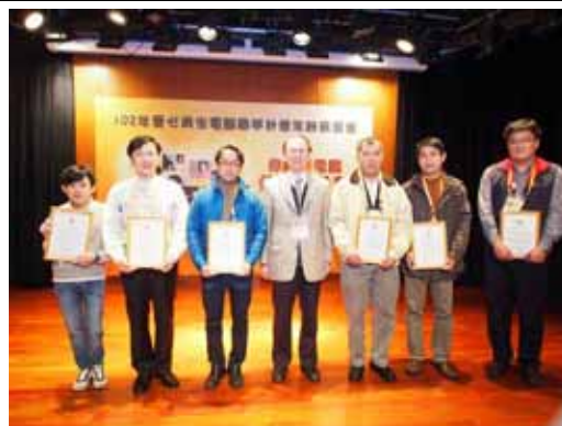
頒發感謝狀予今年捐贈廢電腦單位