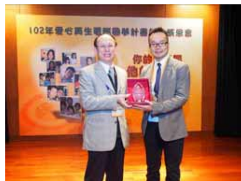
頒發感謝獎牌予今年捐贈廢電腦單位