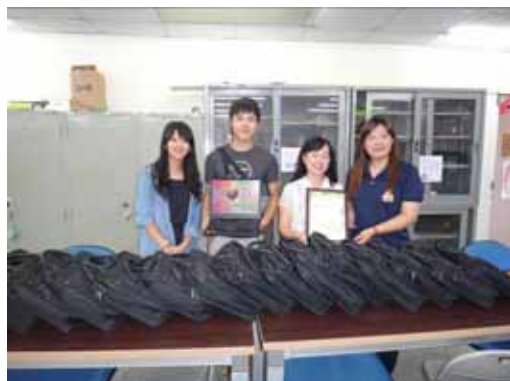
國立臺灣師範大學公民教育與活動領導學系