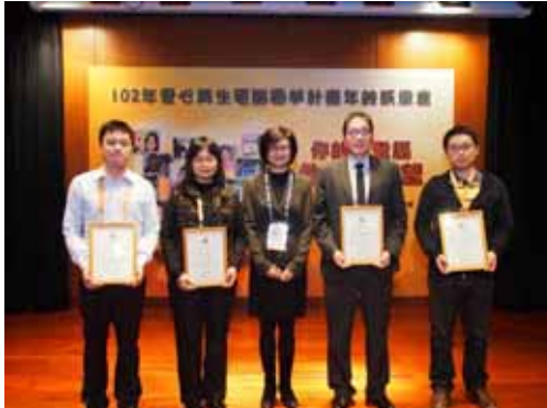
頒發感謝狀予今年捐贈廢電腦單位