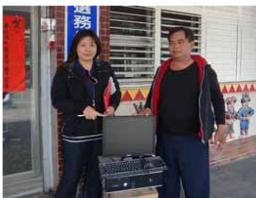
屏東縣牡丹鄉高士佛部落關懷協會