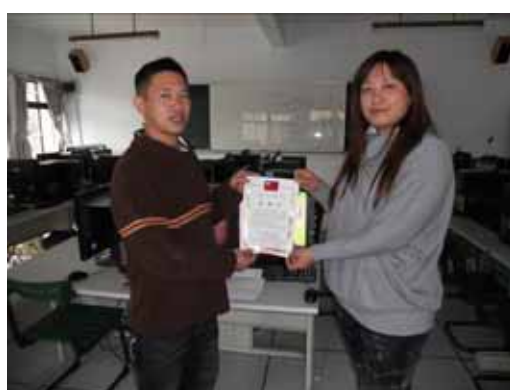
新北市私立中華商業海事職業學校