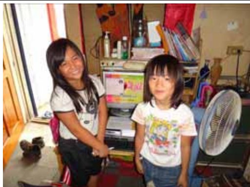
鄭 OO -台東縣東河鄉

經審核後，今年送出 540 台愛心再生電腦，包含 442 名學童，(以低收入或清寒家庭孩童為主)、社會福利團體 98 台(成立宗旨服務中小學童優先贈送)。詳細的受贈名單詳如表 3。