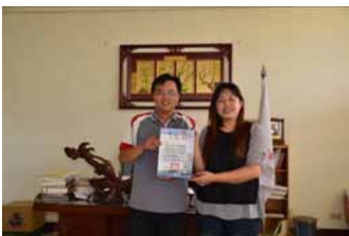
嘉義縣東石鄉龍崗國小