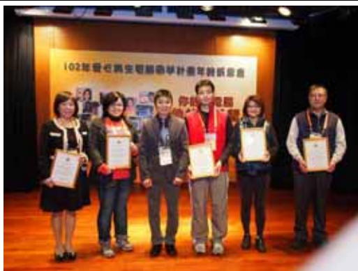
頒發感謝狀予今年捐贈廢電腦單位