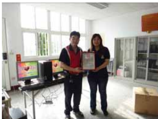
平興社區發展協會